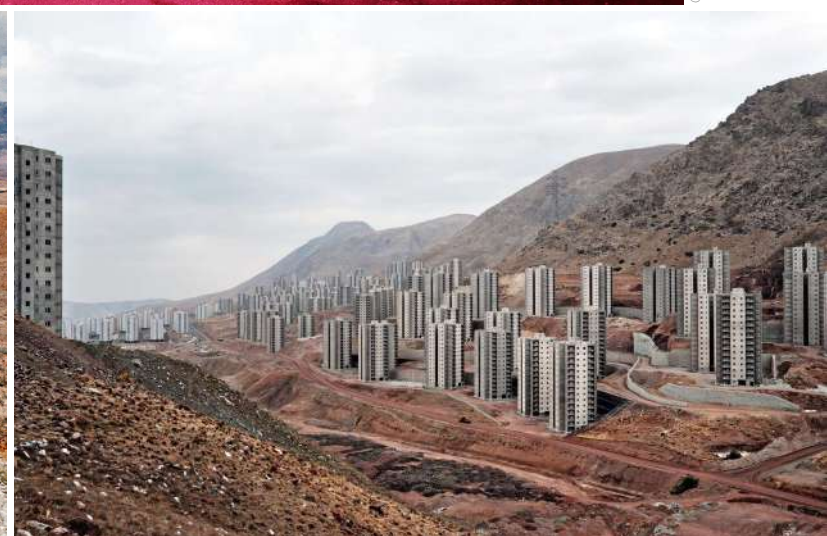
Pardis, Iran, 2017.